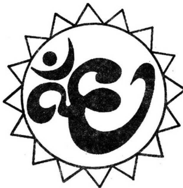
Рисунок для фиксации глаз